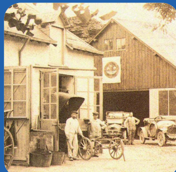
© Carte postale - Garage GUIGNARD à Vatan

Directly from GUIGNARD brothers collection, the automobile Museum of Valençay presents about 80 years of the French car industry. Garage owners from father to son since 1906, members of the family GUIGNARD preserved over the years, the cars that they possessed and even enriched their collection.